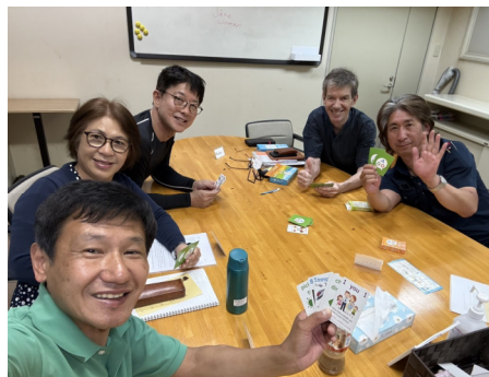
Looks like fun! Let's join and enjoy together!