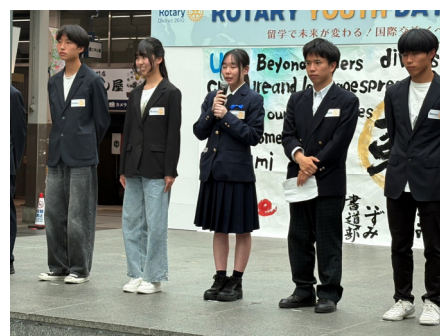
わか菜ちゃんの留学への抱負