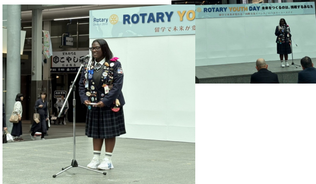
弓道部での日本でしか味わえない体験を発表！