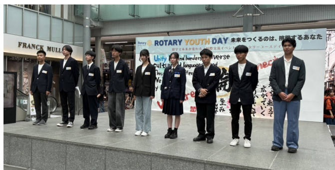
今夏留学されるワクワクドキドキの皆さん