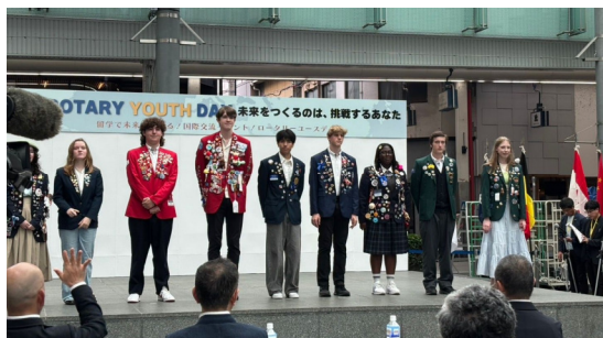
スピーチコンテストに参加の受入留学生の皆さん